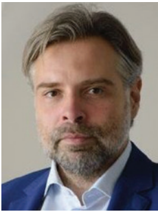
Олександр Каленков Президент Укрметалургпром